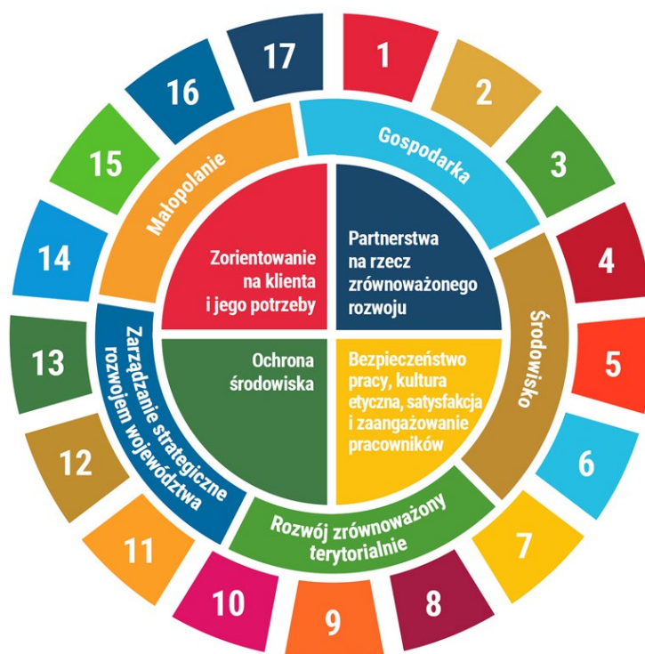
Rysunek 2 Diagram zależności: Agenda 2030, Małopolska 2030, SOB

Diagram zależności obszarów SOB z obszarami Strategii Rozwoju Województwa „Małopolska 2030” oraz 17 celami zrównoważonego rozwoju określonymi w Agendzie 2030 na rzecz zrównoważonego rozwoju 1 .