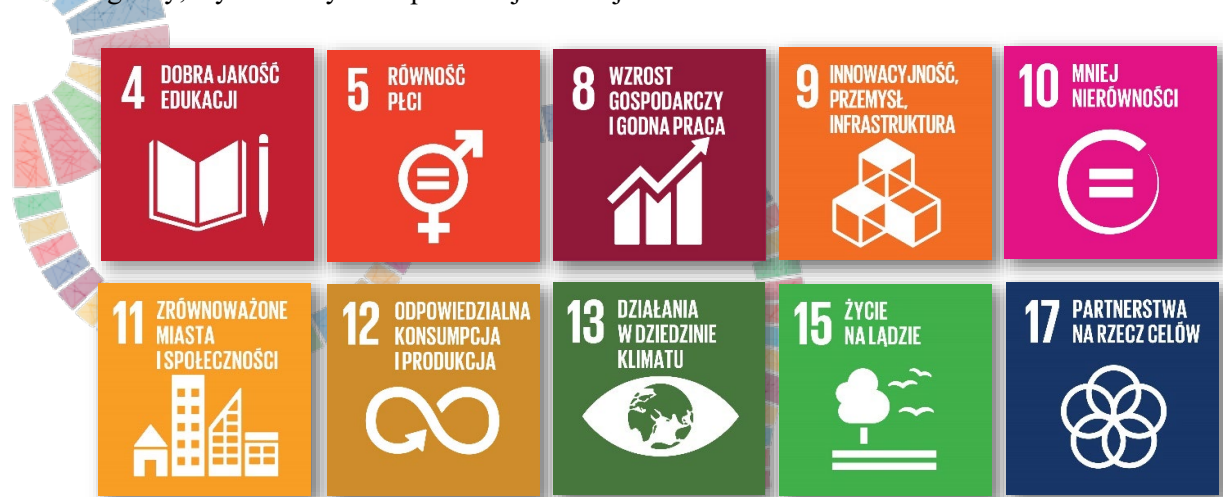
Rysunek 1 Cele zrównoważonego rozwoju bezpośrednio implementowane w SOB

Jednocześnie SOB odpowiada na wyzwania Agendy na Rzecz Zrównoważonego Rozwoju 2030, koncentrując się głównie na działaniach w ramach realizacji dziesięciu z siedemnastu sprecyzowanych celów Agendy, wymienionych na poniższej ilustracji.